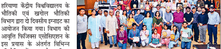
महेन्द्रगढ़। समापन सत्र में उपस्थित कुलपति, समकूलपति, शिक्षक एवं विद्यार्थी।