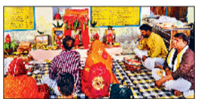
महेन्द्रगढ़। गोशाला में पूजा करते हुए।