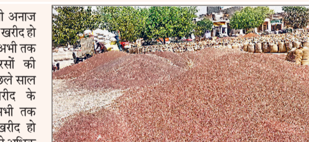
मंडी अटेली। सरसों की ढेरियों से अटी हुई अनाज मंडी।