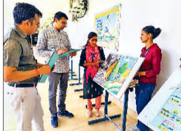
महेन्द्रगढ़। विद्यार्थियों द्वारा बनाए गए चित्र देखते अतिथि।