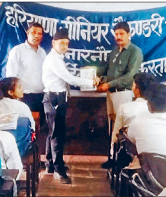
नारनौल। नए मतदाताओं को प्रशिक्षण देते प्रगतिशील शिक्षक ट्रस्ट के सदस्य तथा ईवीएम पर वोट डालकर देखते भविष्य के मतदाता।