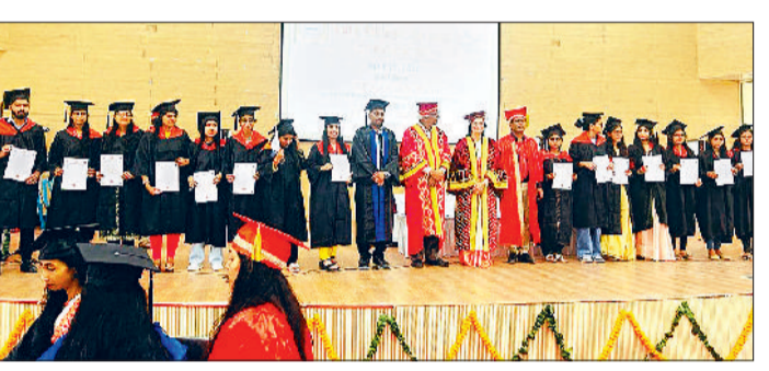
नारनौल। दीप प्रज्वलित कर कार्यक्रम का शुभारंभ करते मुख्य अतिथि व प्राचार्या तथा समारोह में डिग्री प्राप्त करने वाले विद्यार्थी व अतिथिगण।