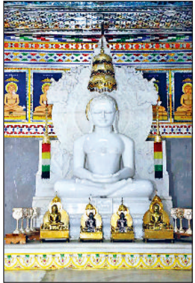
नारनौल। श्री 1008 शांति नाथ दिगंबर जैन मंदिर।