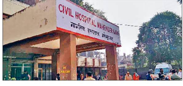
महेंद्रगढ़। नागरिक अस्पताल का भवन।

शहर में आवारा कुत्तों का आंतक प्रतिदिन बढ़ता जा रहा है। शहर के मुख्य चौकों पर अक्सर आवारा कुत्तों के झुंड घूमते देखा जा सकता है। आलम यह है कि आवारा कुत्तों से डर कर लोग सुबह व देर रात को घरों से निकलने से भी कतराने लगे हैं। सिविल अस्पताल के आंकड़ों पर नजर दौड़ाई जा तो दो दिनों में आवारा कुत्तों ने 20 लोगों को काटकर घायल किया है। स्थिति यह है कि रात के समय शहर की कॉलोनियों और मुख्य मार्गों पर दो