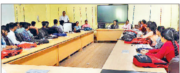
महेन्द्रगढ़। कार्यक्रम में अपने विचार रखते अतिथि।