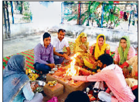
नारनौल। हवन में आहुति डालते हुए।