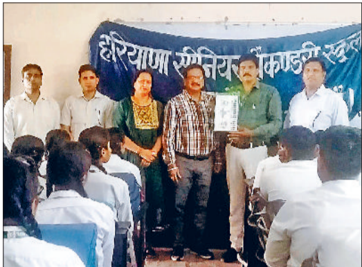
नारनौल। नए मतदाताओं को प्रशिक्षण देते प्रगतिशील शिक्षक ट्रस्ट के सदस्य तथा ईवीएम पर वोट डालकर देखते भविष्य के मतदाता।