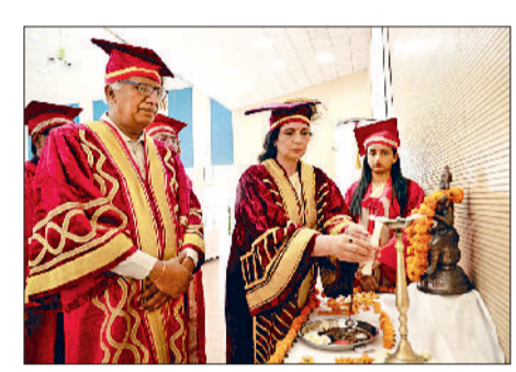
नारनौल। दीप प्रज्वलित कर कार्यक्रम का शुभारंभ करते मुख्य अतिथि व प्राचार्या तथा समारोह में डिग्री प्राप्त करने वाले विद्यार्थी व अतिथिगण।