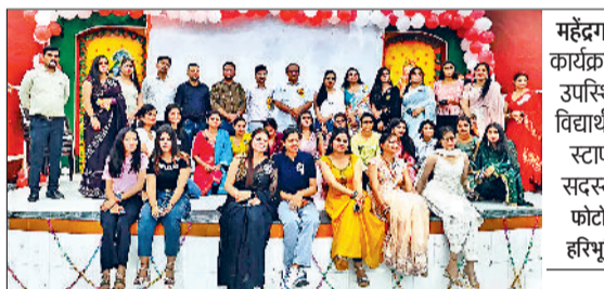
महेन्द्रगढ़। कार्यक्रम में उपस्थित विद्यार्थी व स्टाफ सदस्य।