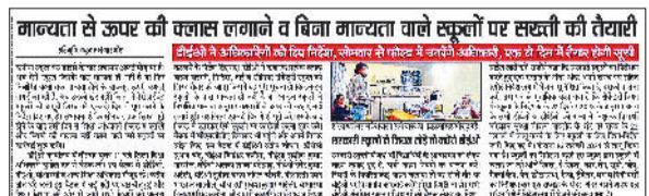
नारनौल। दैनिक हरिभूमि में 19 अप्रैल को प्रकाशित समाचार।

कनीना स्कूल बस हादसे से सबक न लेते हुए सरकार द्वारा मांगी गई अवैध स्कूल की रिपोर्ट में अब कलेक्टर मुखिया भी खेल कर रहे हैं। कुछ रिपोर्ट देने को तैयार नहीं है तो कुछ अपनी रिपोर्ट में सच्चाई को छुपाकर अवैध स्कूलों व स्कूल संचालकों की खामियों को छुपा रहे हैं। जिससे खफा आला अधिकारियों ने जल्द पूरी रिपोर्ट देने के निर्देश दिए हैं। स्कूल के बस हादसे के बाद शिक्षा विभाग ने सखी बरतनी आरंभ कर दी है। बीते दिनों बीईओ को पत्र भेजकर ब्लॉक वाइज अवैध