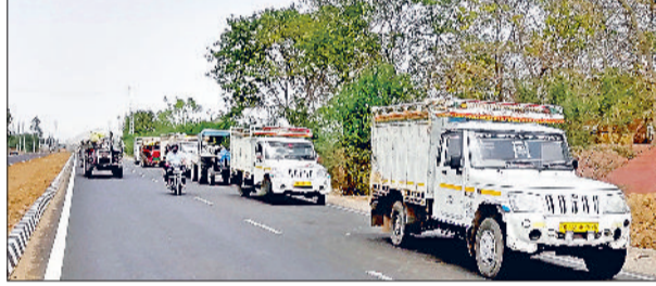
नारनौल। प्रवेश नहीं मिलने पर सड़क पर खड़े सरसों से लदे वाहन व बिना शेड्यूल आने पर मंडी के बाहर ही रोक दिए गए ट्रैक्टर-ट्राली और रिकार्ड तोड़ आवक होने पर सरसों से भरी पड़ी मंडी।

उल्लेखनीय है कि आजकल जिले की अनाज मंडियों में सरसों की आवक पीक पर है। किसान नई-पुरानी जैसी भी सरसों उनके पास मौजूद हैं, सारी मिक्स करके मंडियों में ला रहे हैं। इस कारण मंडियों में अव्यवस्था बनी हुई है और खरीद अधिकारियों को देर रात तक जागकर मंडियों में सरसों की खरीद करनी पड़ रही है। अकेले नारनौल मंडी में गुरुवार को 2009 किसानों के गेटपास बनाए गए। किसान सुबह आकर मंडी में गेटपास के लिए लाइनों में लगे थे और अंधेरा होने तक भी तक लाइनों में डटे रहे। मंडी में 26 मार्च से सरसों खरीद शुरू हुई थी। शुरूआत में